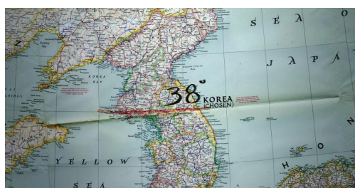
38. breddegrad, hvor Yi I bl født (skillet mellom Nord- og Sør-Korea.

Yul-Gok (Yulgok) er pseudonymet til den store filosof og akademikeren Yi I (1536-1584), som fikk kallenavnet "Koreas Konfusius". De 38 bevegelsene i mønsteret referer til breddegraden til hans fødested, og diagrammet representerer "Læreren".